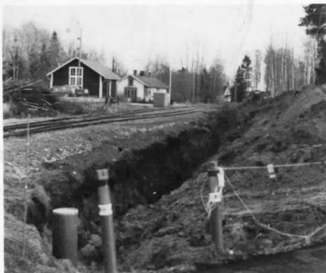
(här grävs avloppet från Järle station ner)

Totalt har Stiftelsen Nora Järnvägsmuseum och Veteranjärnväg (NJOV) fått 1,3 milj. kronor för anläggningarna i Järle och i Nora. Mellan 600.000-700.000 kronor räknar man med att renoveringen av Järle Station ska kosta - pengar som helt bekostas av AMS.