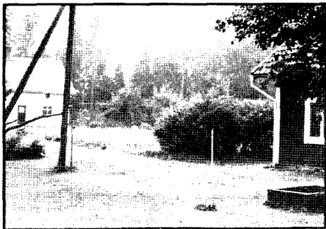
MELLAN MATILDELUND OCH KULLEN KOMMER DAGHEMMET ATT BYGGAS