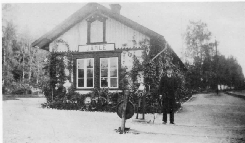
Ake Ljudén som tågklarare vid Järle Station i början av 1940-talet.

Man hade skiftgång vid stationen vilket innebar att 1:a skiftet började kl. 05.00 när första tåget från Nora kom och 2:a skiftet fick gå hem efter 23.00 då sista tåget till Nora lämnat stationen. Ett minne som Åke har från tiden som tågklarare var när 2 järlebor skulle resa till Nora-marken. De satt och samtalade inne i väntrummet och hörde aldrig utropet när tåget skulle gå. Så de blev kvar på stationen.