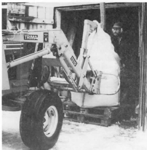
(storsäck används ibland)

-Hur kom det sig att du började med rensning?