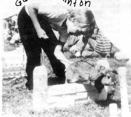
Här går det undan!