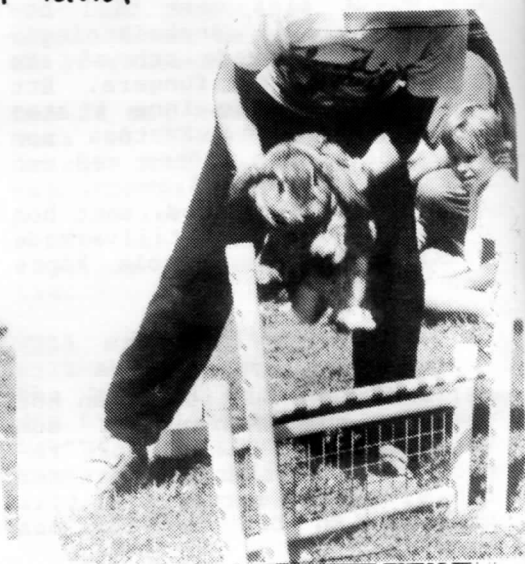
Men här gick det inte alls!