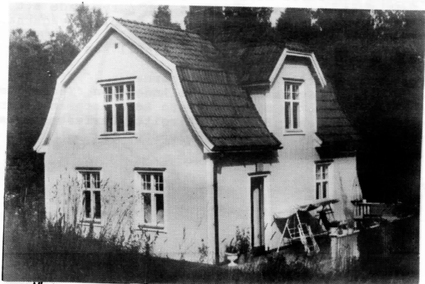
Väster- och söderfasaden